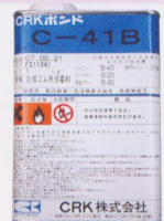
ボンドC-41 (使用量1kg缶で約50m)