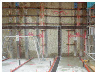
土留壁、捨コンへの設置 (写真I型)