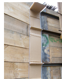
アングルを跨ぐ箇所への設置 (写真NII-200型)