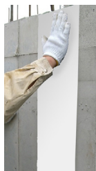
躯体外側からの直接貼付 (写真II型)